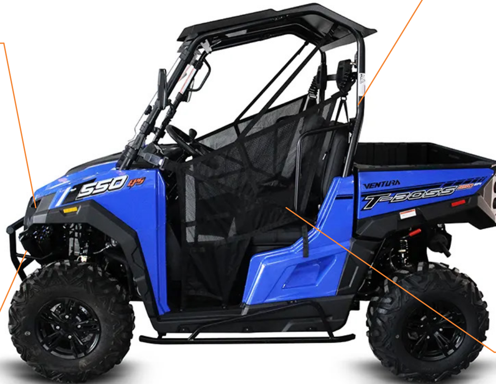
MALACATE ELÉCTRICO CON CONTROL