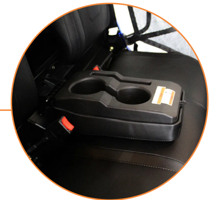
CINTURONES DE SEGURIDAD, PORTAVASOS Y PORTA-CELULAR ENTRE LOS ASIENTOS