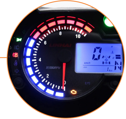
PANTALLA LCD CON VELOCÍMETRO, ODÓMETRO Y MEDIDOR DE COMBUSTIBLE