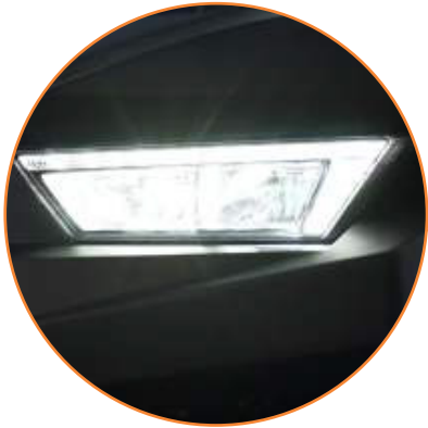
FAROS Y LUCES TRASERAS LED